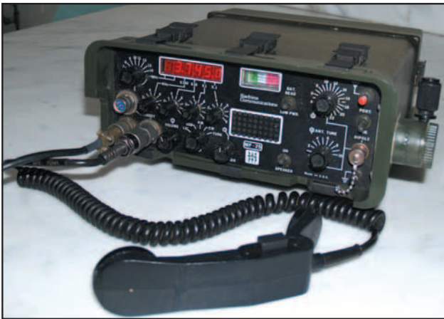
Foto 1 - Ricetrasmittitore KACHINA MP-25